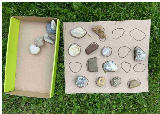
Ilustrace 6: pexeso