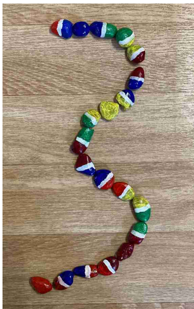
Ilustrace 4: číslice