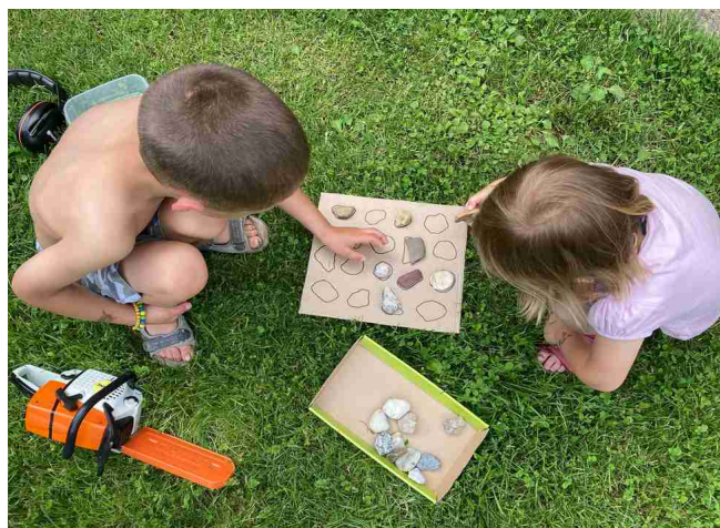
Ilustrace 7: pexeso v praxi