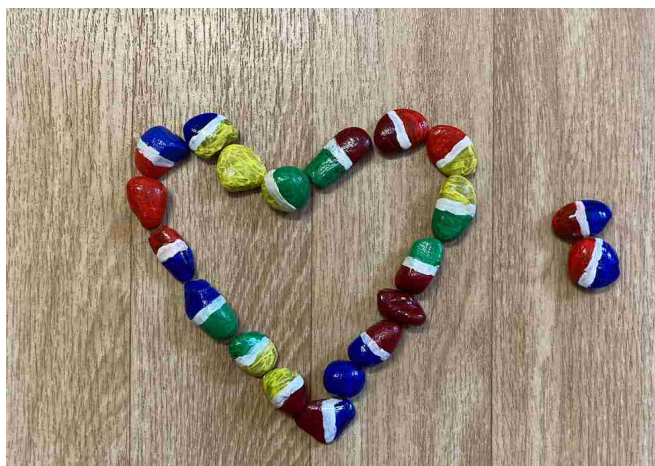
Ilustrace 5: jednoduché tvary