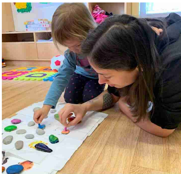
Ilustrace 1: voskovky na horkých kamenech

Kamínky využívá i jako hravou formu výuky vhodnou určitě pro předškoláky i prvňáčky.