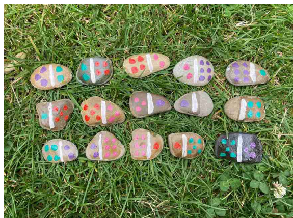
Ilustrace 2: domino