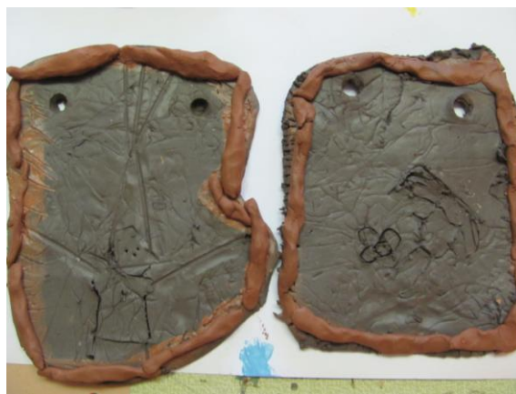
destičky ze syrové, nevyschlé hlíny

Při práci s Keroplastem nebo podobnou umělou modelovací hmotou odpadá vypalování v peci. Výrobek se nechá zaschnout na vzduchu. Lepí se jen vodou a přitlačení částí k sobě. Hmota rychle zasychá na vzduchu, tak je potřeba mít kousky, které nepotřebujeme, schované a uzavřené v plastovém sáčku.