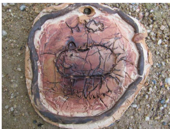
Destičky natřené burelem a podruhé vypálené